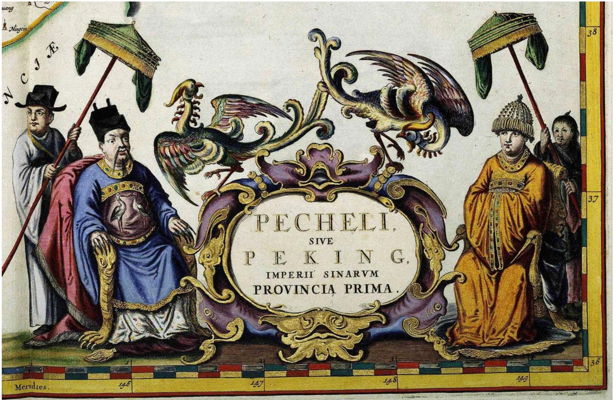
[ Centro studi Martino Martini ]